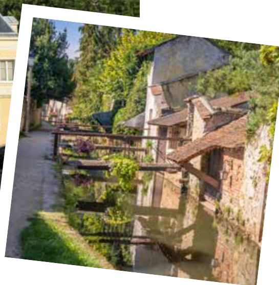
Promenade des petits ponts ▶