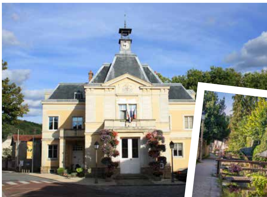
◀ Mairie de Chevreuse

Les chevrotins profitent d'un cadre de vie privilégié, à proximité de Saint-Quentin-en-Yvelines, 2 e pôle économique de l'Île-de-France, et du plateau de Saclay.